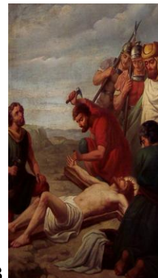
Chemin de croix XI