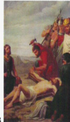
Hl.Pankratius Hl.Donatus Kreuzwegstation XI